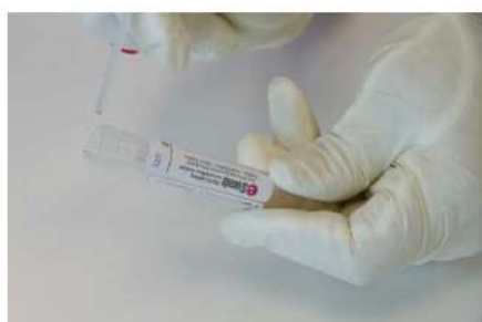
7. Jeter la partie cassée