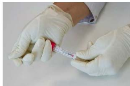
8. Refermer le tube et l'envoyer au labo