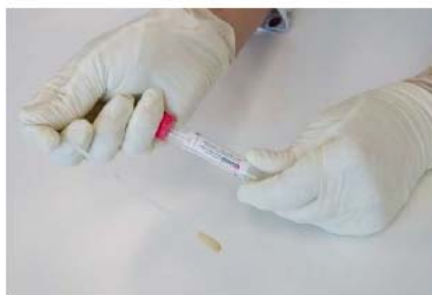
4. Dévisser le bouchon