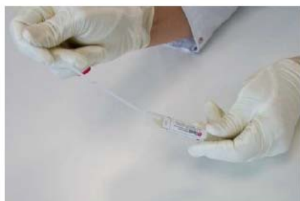
5. Mettre l'écouvillon dans le tube