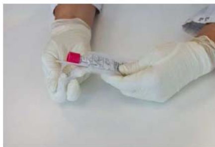
2. Prendre l'écouvillon et le tube