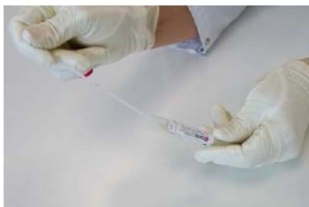
5. Mettre l'écouvillon dans le tube