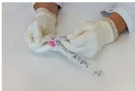
1. Ouvrir l'emballage