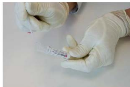
6. Casser la tige au repère