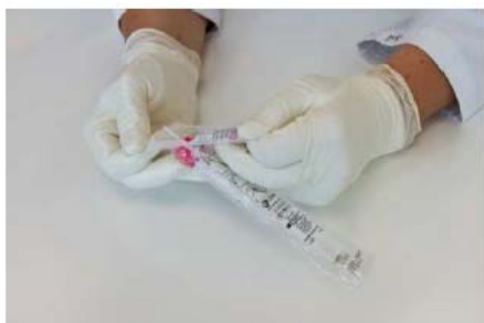
1. Ouvrir l'emballage