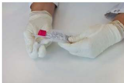
2. Prendre l'écouvillon et le tube