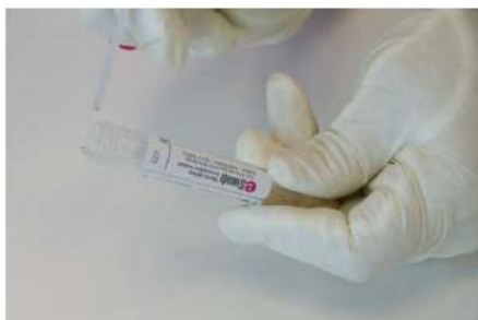
7. Jeter la partie cassée