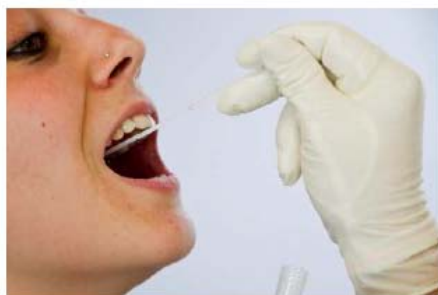
3. Prendre l'échantillon